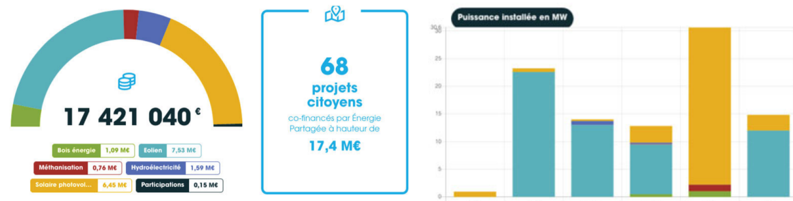
Tableau de bord de nos investissements

> Consultez la calculatrice de tous les chiffres de l'énergie citoyenne et d'Énergie Partagée Investissement