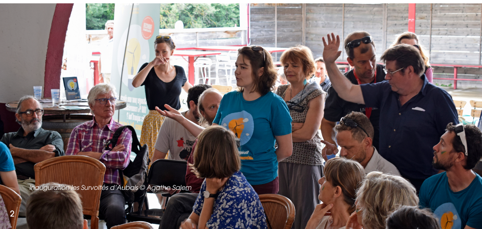
Inauguration les Survoltés d'Aubais

Afin de ne pas générer d'animosité auprès des propriétaires et exploitants, la solidarité et la transparence de l'offre foncière seront mises en place par des réunions communes dédiées.